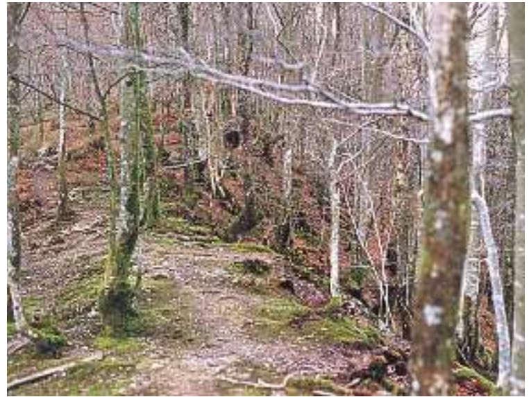
EL ROBLEDAL PRESENTA UN ASPECTO POCO DENSO, CON PIES TORTUOSOS Y DE ESCASO DIÁMETRO.

Además de los comentados paisajes bajo nuestros pies y a lo lejos, podremos disfrutar de las distintas tipologías con las que suelen aparecer nuestros bosques de frondosas. En un corto espacio, habremos recorrido robledales y hayedos trasmochos, plantados, de monte bajo (brotes de cepa) y de monte alto (brotes de semilla). En general