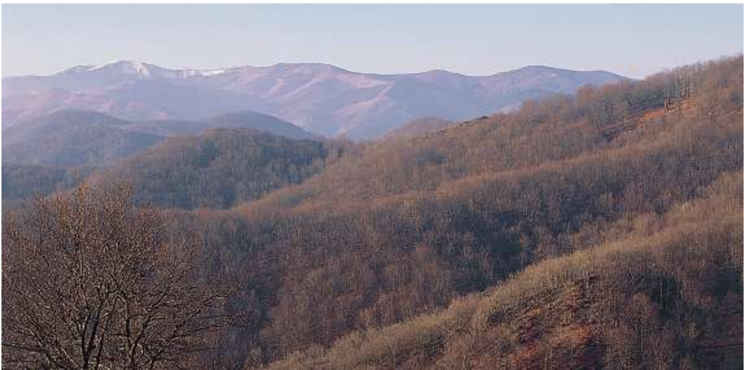
VISTAS DE LA EXTENSA Y CONTINUA MASA DE FRONDOSAS DE LA CUENCA DEL AÑARBE.

Pero el itinerario realmente aconsejado es más largo. Desde la cumbre, habría que descender hacia el sur, siguiendo una divisoria de aguas entre el hayedo (cuenca del Añarbe) y las plantaciones de coníferas del enclave do-