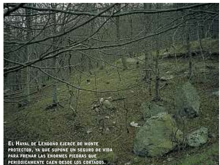
EL HAYAL DE LENDOÑO EJERCE DE MONTE PROTECTOR, YA QUE SUPONE UN SEGURO DE VIDA PARA FRENAR LAS ENORMES PIEDRAS QUE PERIÓDICAMENTE CAEN DESDE LOS CORTADOS.