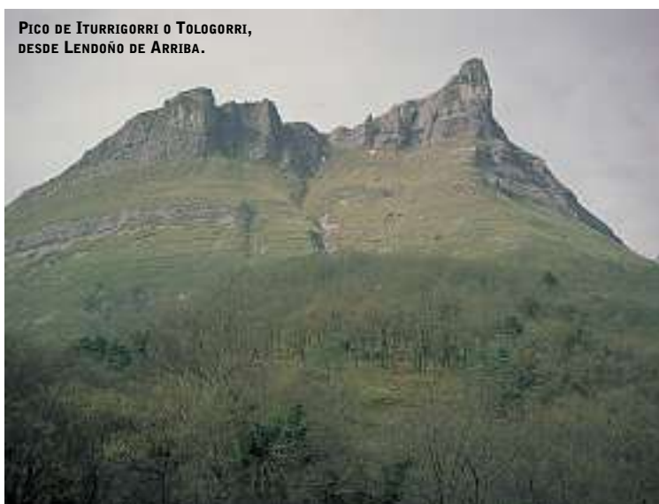
PICO DE ITURRIGORRI O TOLOGORRI, DESDE LENDOÑO DE ARRIBA.

El importante colectivo humano que vivía y trabajaba en sus montes ha sido sustituido por unos pocos ganaderos locales, cazadores y recolectores de setas que, ocasionalmente, nos podemos encontrar. Por dar un ejemplo, en 1825 se contabilizaban unos 600 labradores y jornaleros en Orduña, un