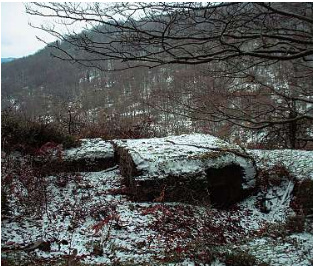
EN LOS MONTES QUE RODEAN VILLARREAL AÚN SE PUEDEN ENCONTRAR BUNKERS.

(los pantanos actuales aún no existían), el camino hacia una desguarnecida Vitoria habría quedado despejado, pero se decidió tomar antes el pueblo. Tal vez la guerra hubiera cambiado de signo en el otro caso, pero ya no se sabrá nunca.