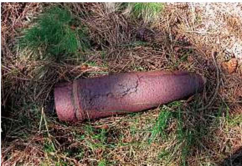
DE VEZ EN CUANDO VEN LA LUZ ANTIGUOS OBUSES Y GRANADAS EN VARIABLE ESTADO DE CONSERVACIÓN.

La Guerra Civil aún duraría dos años más, pero ya no se combatiría más en el País Vasco, salvo alguna acción esporádica de los "maquis".