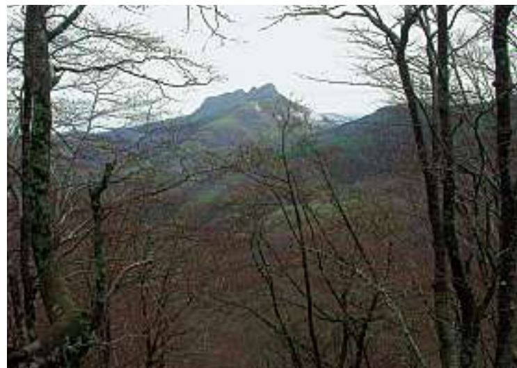
VISTA DE AIAKO HARRIA DESDE LOS MONTES DE OIARTZUN.